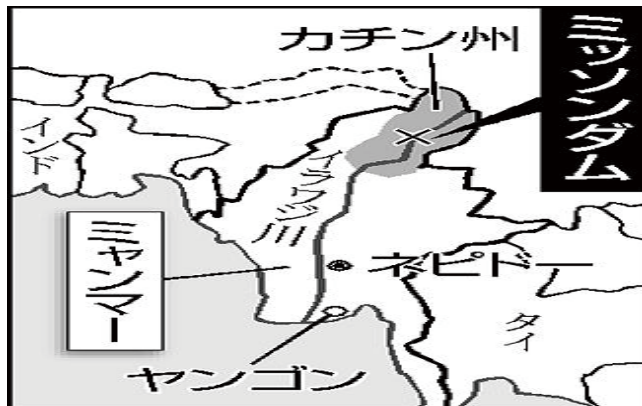
図3 イラワジ川とミッソンドムの位置